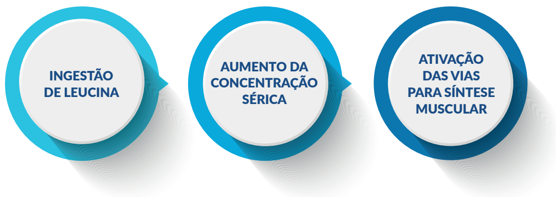
Figura 4 – Leucina e síntese muscular

Pacientes com câncer apresentam aumentos nos fatores inflamatórios, sendo que o aumento destes influencia negativamente a síntese proteica. Contudo, há evidências de que a suplementação de proteína e leucina são importantes para influenciar positivamente na síntese proteica mesmo na presença dos fatores inflamatórios elevados 44 .