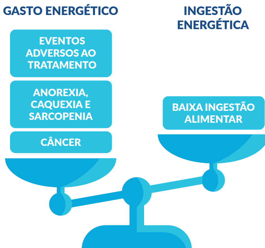
Figura 2 – Fatores que levam à perda de peso e desnutrição em pacientes oncológicos.

Isso acontece pela associação de alguns fatores como aumento do gasto energético pela presença do tumor, interferências no paladar e olfato e efeitos colaterais do tratamento oncológico como náuseas, vômito, diarreia, mucosite (inflamação das mucosas), xerostomia (boca seca) e outros relacionados ao tratamento quimio e/ou radioterápico 4,6-8 (Figura 2).